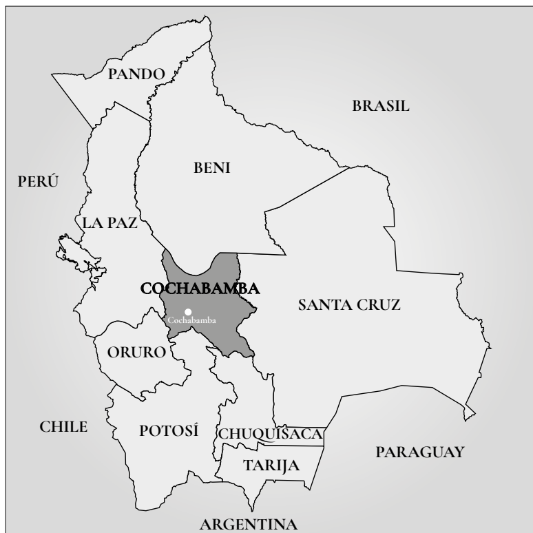
Mapa 1. Ubicación de Cochabamba en el territorio boliviano

Desde el Centro de Estudios Populares (CEESP), nos hacemos varias preguntas sobre el trasfondo de esta dinámica de violencia que tiene como asidero a Cochabamba. La primera y más relevante tiene que ver con los motivos que llevan a que en este departamento y, en particular, en su ciudad capital, se gesten, en ciertos momentos, esta escalada de violencia que termina enfrentando de manera directa a distintos sectores de la sociedad civil.